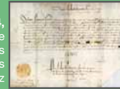
Signature Henri IV

A l'occasion de la pose d'une plaque au 34, Quai Louis Durand, sur la maison historique de la famille Godet, des visites guidées dans les chais du Cognac Godet sont proposées dans la zone des Rivauds-Nord, à Laleu : Venez découvrir l'histoire du Cognac et de cette famille, qui depuis Bonaventure Godet se côtoie, lui qui fut commerçant hollandais en 1588 à La Rochelle et initia l'histoire du vin brûlé.