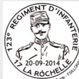
La Poste - FILLORAY

Exposition BD : Paroles de Poilus 1914-1918 avec différents auteurs, 10h30 & 15h30 parcours de 45 mn commenté par l'auteur rochelais Florent Silloray.