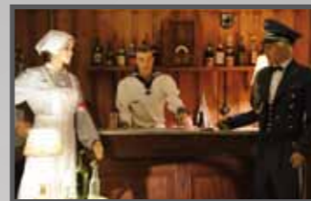
Bunker de La Rochelle