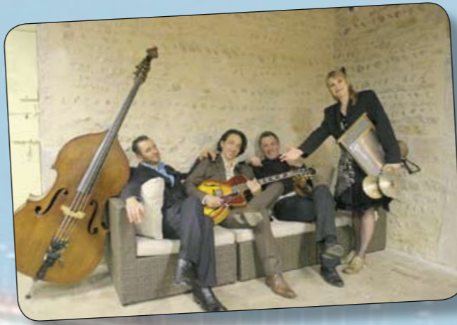
Depuis 1976, Sweet Mama poursuit sa «petite bonne femme de route» en Europe, passant aussi par les meilleurs festivals de blues ou de jazz de France pour un blues très teinté charleston, jazz, jump et groovy : inclassable et réjouissant ! www.sweetmama.fr.st