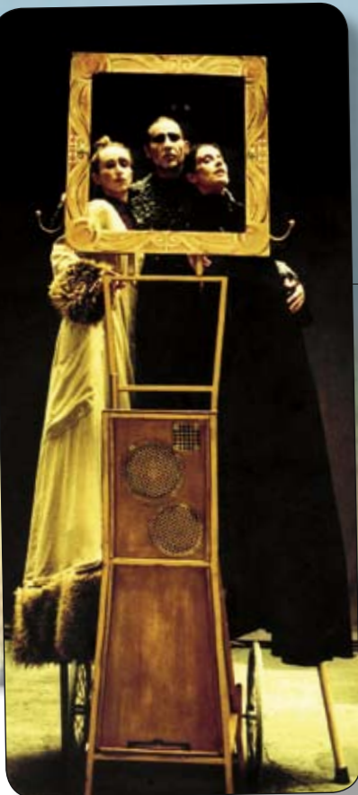
VOIVER, le regard en arrière Le tango n'est pas qu'une danse. Sous sa forme la plus pure, c'est l'accord des sens, un concentré d'émotions brutes. www.triadenomade.fr

22h00 SHADJA* (World fusion jazz) www.myspace.com/groupeshadja